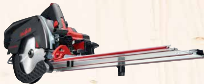
Kappschiene-Säge KSS 60 18M bl