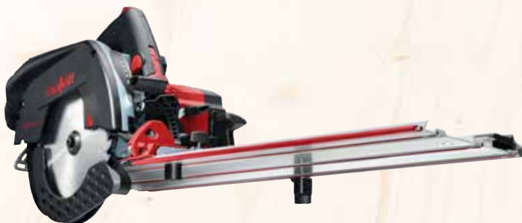
Kappschiene-Säge KSS 50 cc im Transportkoffer Art.Nr.: 918902