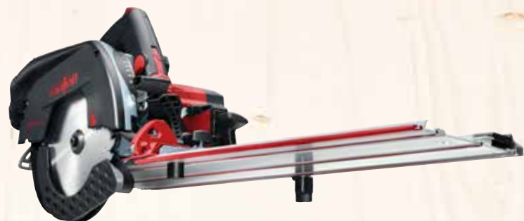
Kappschiene-Säge KSS 50 cc Art.Nr.: 918901