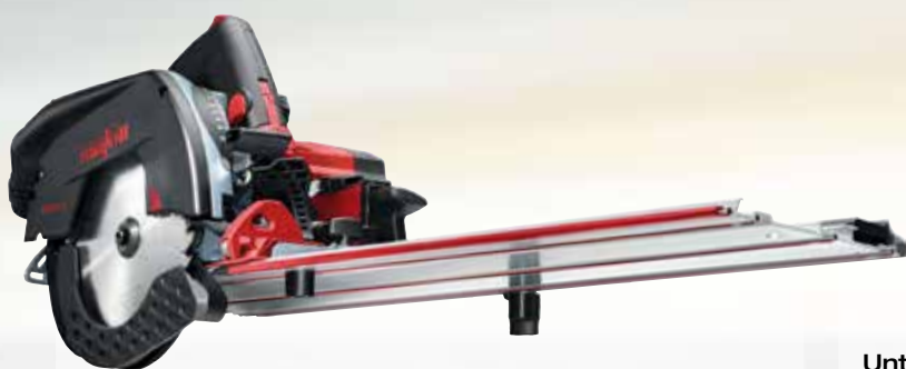
Kappschiene-Säge KSS 50 18M bl im Transportkoffer Art.Nr.: 919301