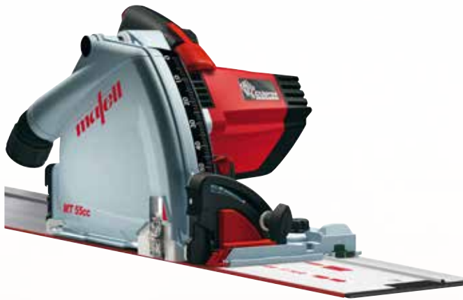
Tauchsäge MT 55 cc MidiMAX im T-MAX mit F 160 Art.Nr.: 917613