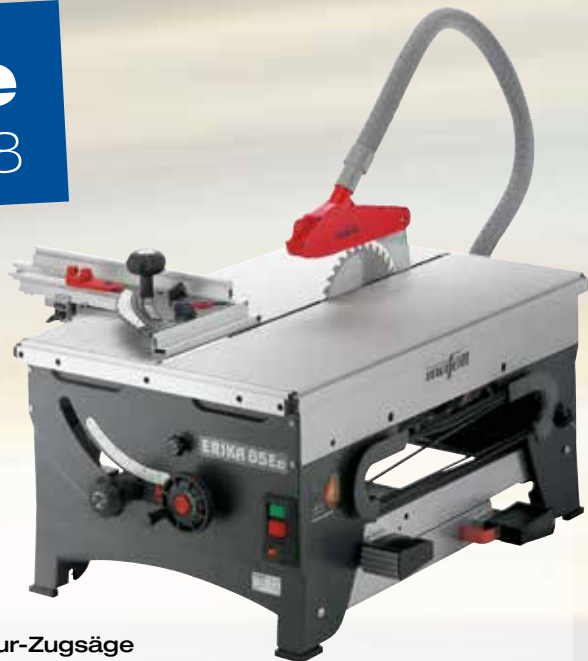
Unterflur-Zugsäge ERIKA 85 Ec Paket Art.Nr.: 971650